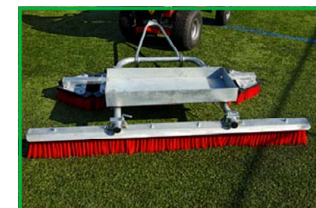
Optional litter tray