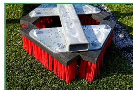
Zig Zag brushes

* Variable ** Optional litter tray adds 16.5 kgs to weight