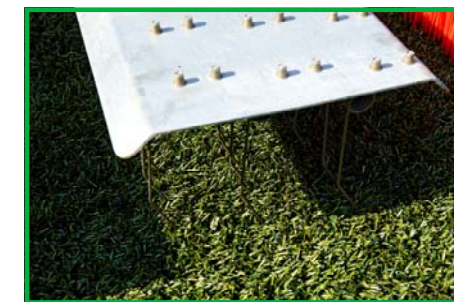
Metal raker tines